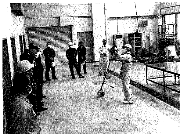
【刈払機取扱作業安全衛生教育】