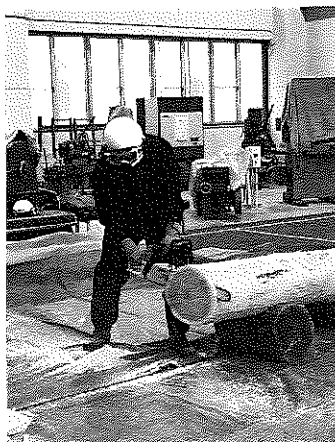
【伐木(チェーン)特別教育】