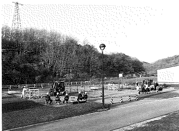
【フォークリフト運転技能講習】