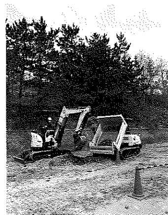
【不整地運搬車運転技能講習】