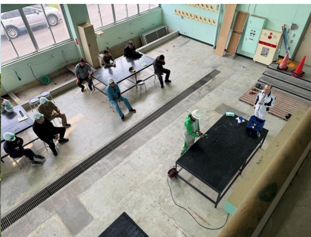
自由研削砥石取り扱い業務