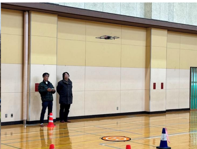
ドローン基礎技能講習