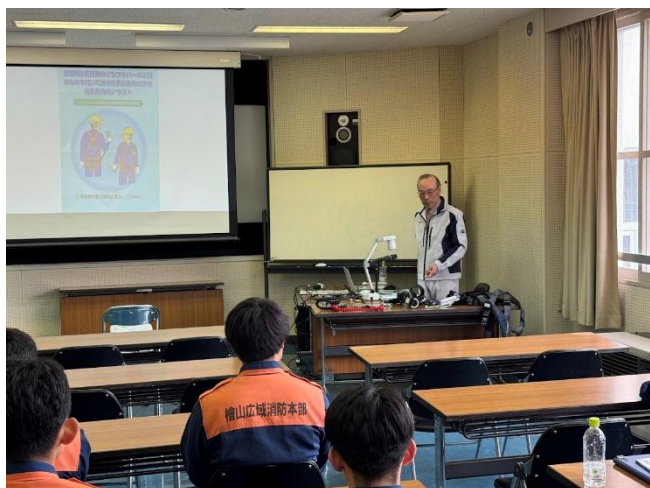
フルハーネス型安全帯使用作業