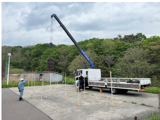
小型式移動クレーン運転技能講習